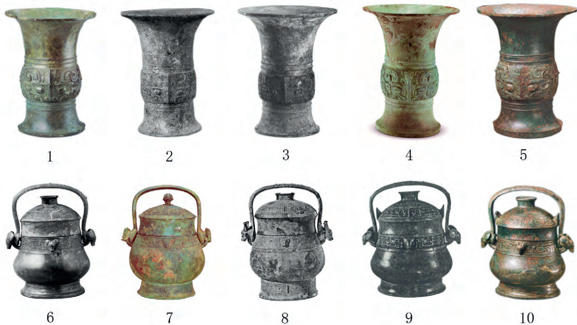
图四 曲村 M6210 出土尊、卣及其比较

不唯如此, 从随葬品的种类和数量看, M6210 均多于 M6069。可见, 两墓虽然均为三鼎