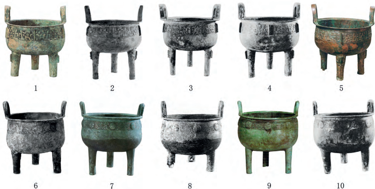
图一 曲村M6069出土铜鼎及其比较