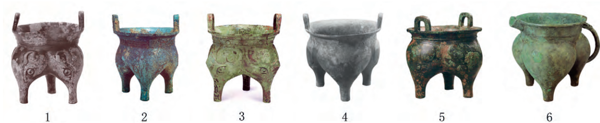
图三 曲村M6069、M6210出土铜鬲及其比较

曲村M6069和M6210还各出1件铜卣,形制、纹饰基本相同,唯大小有别,盖铭均作“敝作毕父宝尊彝”,相同铭文的器物还有前文提到的曲村M6210:8铜尊,它们应是作器者生前同时使用的一套组合。