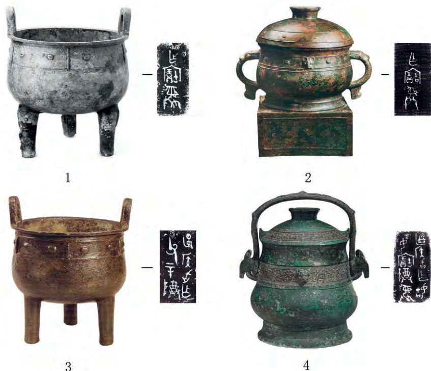
图二 曲村M6210出土铜鼎及其比较

1. 曲村M6210:1 2. 76云塘M20:1 3. 燕侯旨鼎 4. 大河口M1:276