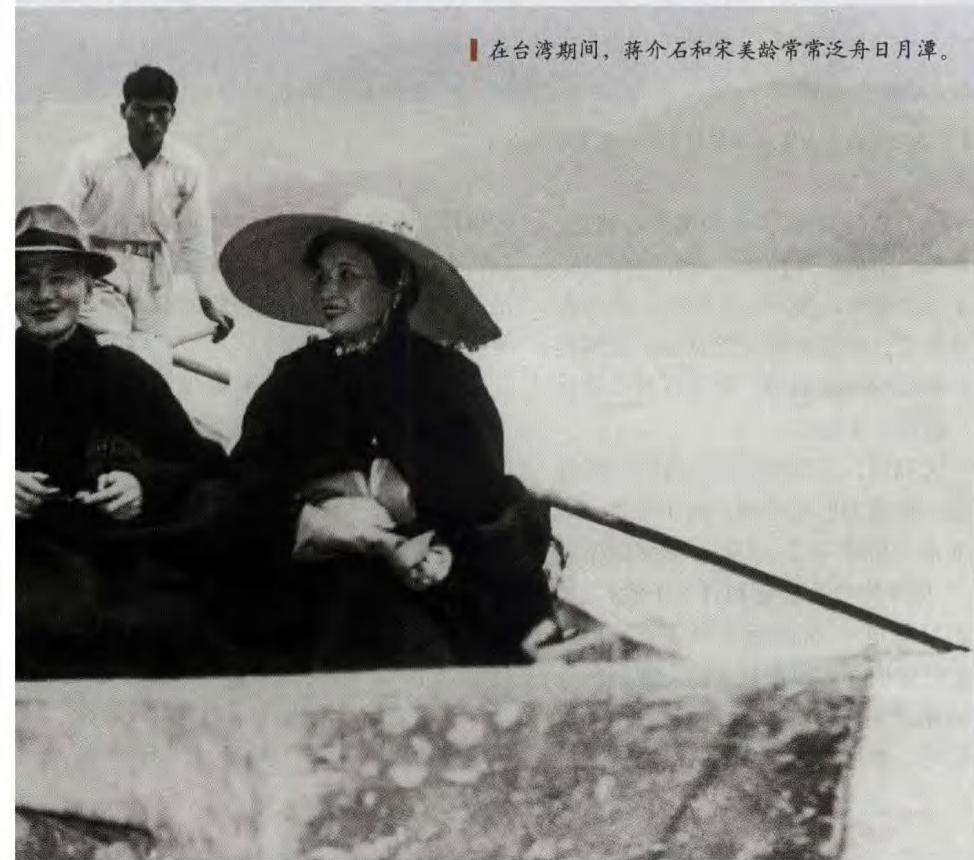
在台湾期间，蒋介石和宋美龄常常泛舟日月潭。

在阅读马列著作的过程中，蒋介石起先接受了某些观点。1925年11月，他要为黄埔军校第三期同学录作序，打