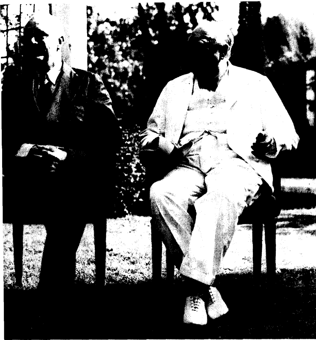
1943年11月25日，蒋介石（左）与美国总统罗斯福（中）、英国首相丘吉尔（右）在开罗会议上合影。