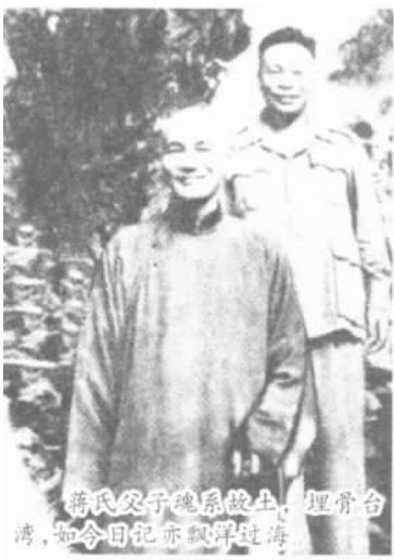
蒋氏父子心系故土,埋葬台湾,如今日记亦飘洋过海

该消息一经公布后,立刻在海内外激起热烈的反响,其影响已远远超越了历史学界,许多人认为这批日记如能公布,对进一步解开近代许多历史谜团会有大的帮助。