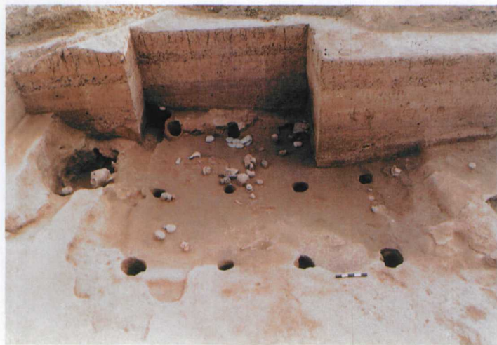
图一 F20 地面建筑遗迹 (北→南)