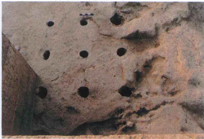
图二 F21 干栏式建筑遗迹 (北→南)