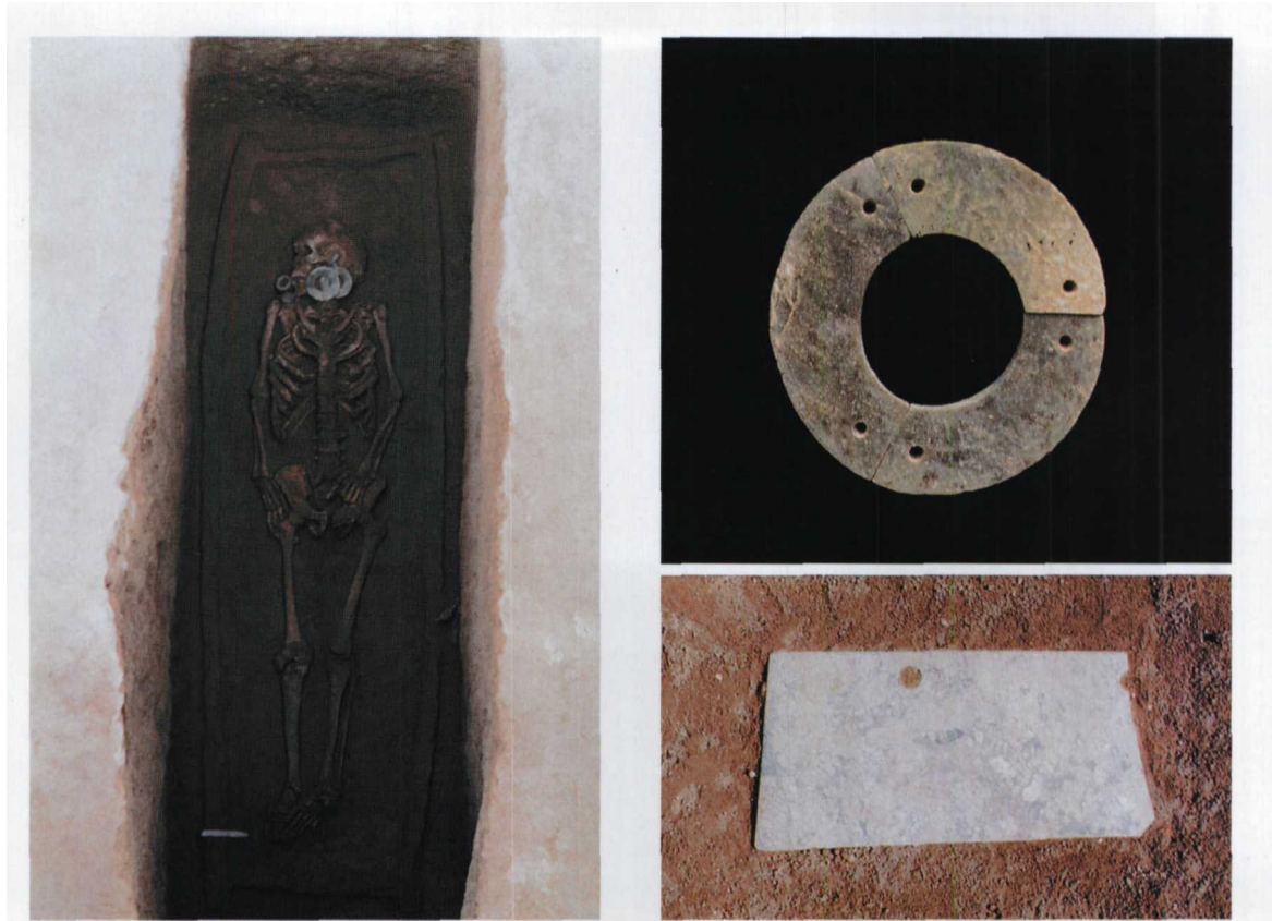
图四 M17 出土人骨及随葬玉器（南→北）