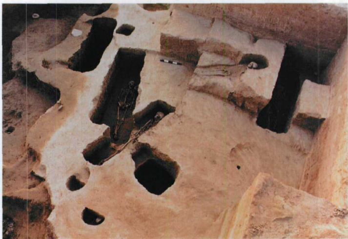
图六 土台边沿的祭祀性墓葬（东→西）

土台顶部的 M17 是一座规格比较高的墓葬。特殊的是，清理出来的墓口呈“回”字形双重开口（图三），即在长方形土坑墓口上还套有一个接近方形的更大的浅口。